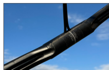
◀ブレーキレバーから外溝に沿って挿入し、ステムクランプ部から出てステム内を通る内外装対応方式

▶新製品も多数掲載しておりますが、マイナーチェンジのアイテムもあります。その中で先取りピックアップするのは「OnebyESU グランモンロー SLi (エスエルアイ)」です。これまでモンローから始まりグランモンロー、グランモンロー SL と進化してきましたが、SLi ではステム内を通すケーブル内装に対応させたホールを設けました。勿論外装もこれまで通り可能で、サイズ構成も同じくSS・S・M・Lの4サイズを揃えています。SLi の販売はSSとSサイズから2月初旬スタートとなります。