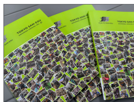
▲表紙に使わせていただいた写真の総数・・・何枚でしょう・・・

▶1月25日に「TOKYO SAN-ESU UNIVERSAL CATALOG VOL.31」を発行いたします。今年も「Made in 羽根倉通り」「Designed in 東京上野御徒町サンエス本社」「Editing by サンエス社員」・・・サンエス本社で社員が編集し