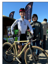
▲ここに掲載させていただいたのは少しいますが多くの皆様がOnebyESU シクロクロスで奮闘されましたことに感謝申し上げます。