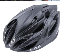
カーボン柄 / トランス