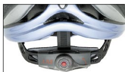
Velox Size System