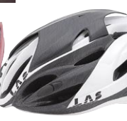
カーボン柄 / WH