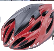
カーボン柄 / RD