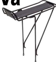
MTB キャリア ¥3,150 (本体 ¥3,000)