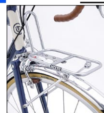
キャンビー M-19 ¥10,500 (本体 ¥10,000)