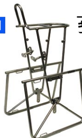
キャンビー フロント ¥19,425 (本体 ¥18,500)