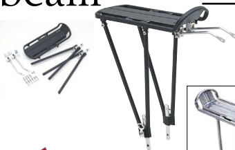
フレキシブルキャリア ¥2,625 (本体 ¥2,500)