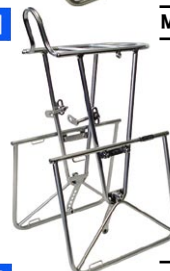
MT キャンビー フロント F20 ¥19,425 (本体 ¥18,500)