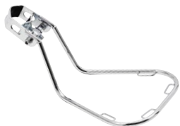
バックサポーター ¥2,830 (本体 ¥2,700)