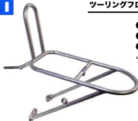
ツーリングフロントキャリア M12 ¥5,565 (本体 ¥5,300)

写真のステーはカンチ用・シートステーボ用両方が取付けられます。自転車に取付ける際は、フレーム仕様に合わせてどちらかをご使用下さい。