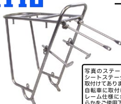
MT キャンビー リア R20 ¥13,125 (本体 ¥12,500)