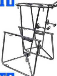
キャンビー リア ¥19,425 (本体 ¥18,500)