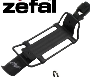
クイックラック 2 ¥3,675 (本体 ¥3,500)