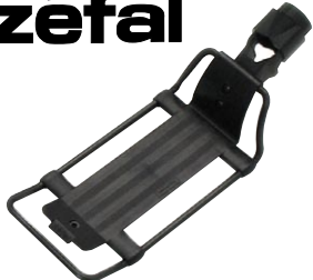
クイックラック ¥3,150 (本体 ¥3,000)