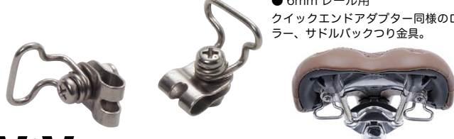
バックループ ¥840 (本体 ¥800)