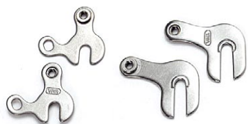
クイックエンドアダプター F:¥893 (本体 ¥ 850) R:¥945 (本体 ¥ 900)