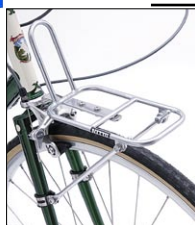
キャンビー M-1 ¥11,550 (本体 ¥11,000)