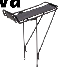
MTB キャリア ¥3,150 (本体 ¥3,000)