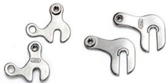
クイックエンドアダプター F ¥893 (本体 ¥850) R: ¥945 (本体 ¥900)