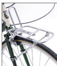
キャンビー M-1 ¥11,550 (本体 ¥11,000)