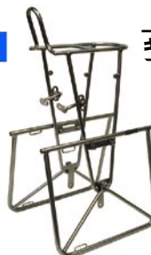
キャンビー フロント ¥19,425 (本体 ¥18,500)