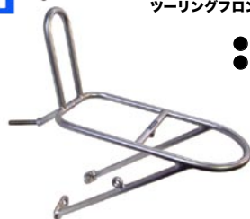
ツーリングフロントキャリア M12 ¥5,565 (本体 ¥5,300)