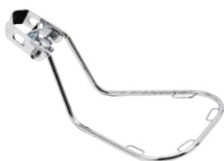
バックサポーター ¥2,830 (本体 ¥2,700)