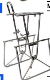
MT キャンビー フロント F20 ¥19,425 (本体 ¥18,500)