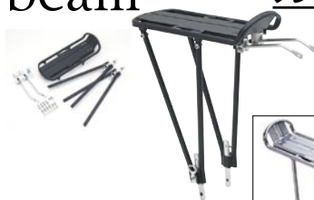
フレキシブルキャリア ¥2,625 (本体 ¥2,500)