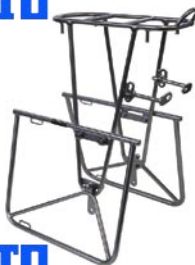
キャンビー リアー ¥19,425 (本体 ¥18,500)