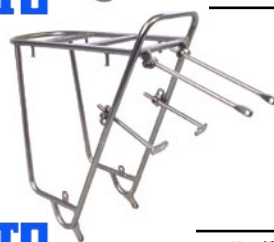
MT キャンビー リア R20 ¥13,125 (本体 ¥12,500)