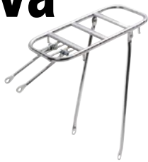
RD-1 レトロキャリア ¥3,045 (本体 ¥2,900)