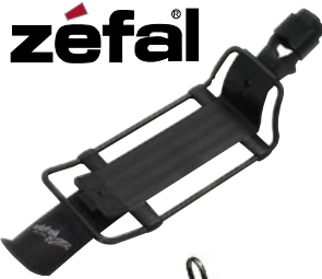
クイックラック 2 ¥2,940 (本体 ¥2,800)