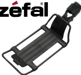
クイックラック ¥2,625 (本体 ¥2,500)